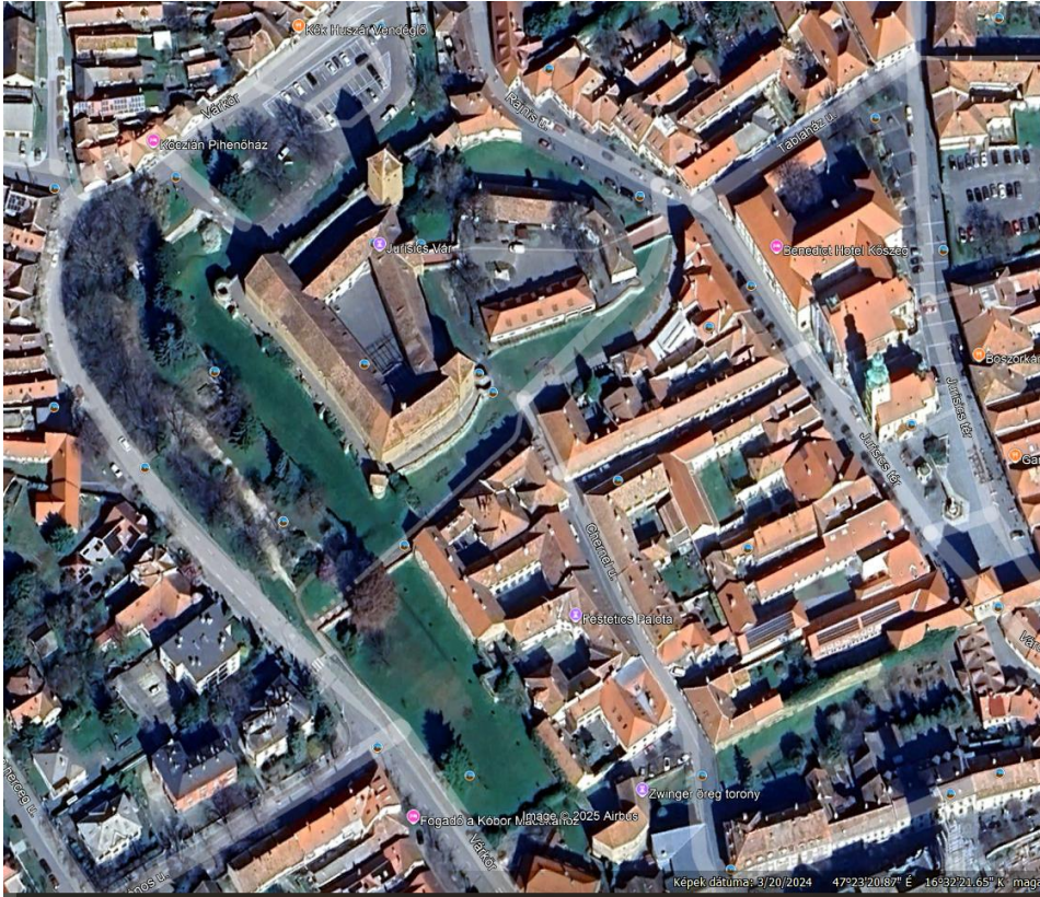
A tervezési terület városi környezete légifotón