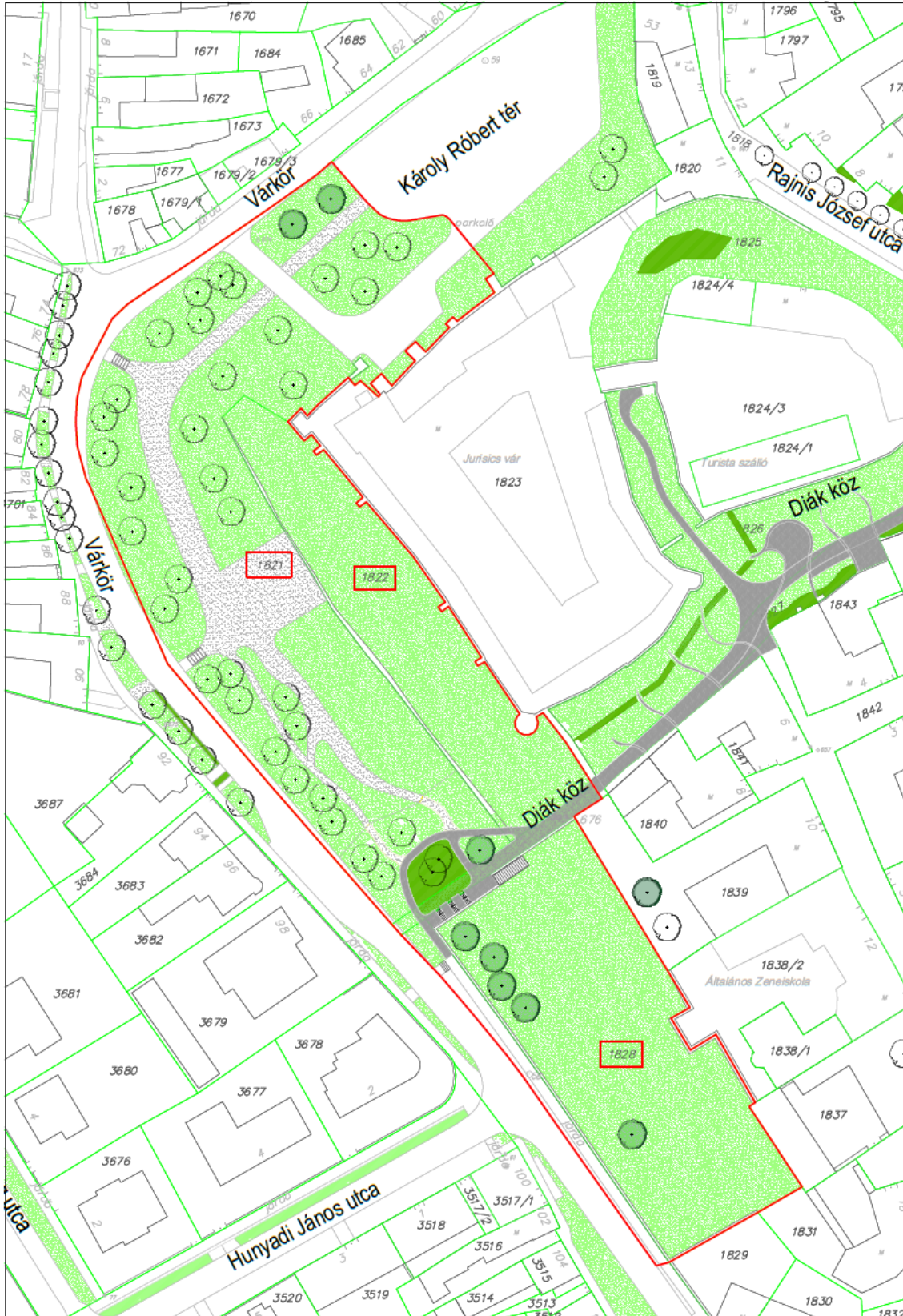
A tervezési terület és környezetének jelenlegi általános elrendezése